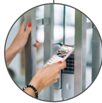
Video- und Zutrittskontrolle